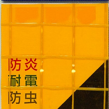
デルマ 350B 2